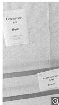
Dans la salle de danse, on gardera les barres et les stores.

Si la rénovation des locaux entraînera forcément un nouvel équipement en matériel et mobilier, tout n'est pas pour autant à jeter : un peu partout dans le foyer fleurissent des petites affichettes pour indiquer ce qui est à garder. Mais il y aura sans doute un nouveau tri à faire au moment du réaménagement.